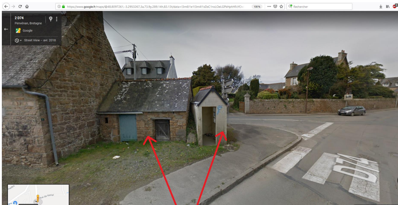
Ancienne crèche Abris bus