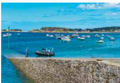
Port de Buguélès

Ce n'est pas un port ! Si la gestion reste du ressort de la commune, la propriété appartient à l'État au travers de la Direction Départementale des Territoires de la Mer (DDTM). Tous les mouillages sont à échouage. La zone est entourée par les îles qui en font un havre particulièrement protégé mais pas toujours simple d'accès.