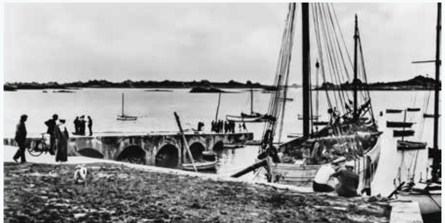
Caboteur à Port-Blanc

* Le cabotage était du transport maritime sur courte distance. Il permettait d'aller vendre les produits de la côte bretonne nord, oignons, pommes de terre, au Pays de Galles via le port de Cardiff et de ramener des produits gallois tels que charbon, bois, tuiles, que l'on ne trouvait pas en Bretagne. Le bornage était du micro cabotage.