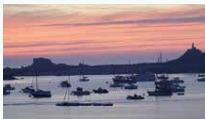
Mouillages de pleine eau à Port-Blanc

Le centre nautique municipal de Port-Blanc propose des stages, formations et locations permettant dans un esprit de service public l'accès aux activités de la mer pour tous. Renommé pour ses activités d'initiation à la plaisance, il est aussi un centre de formation de moniteurs.