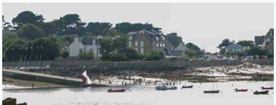
Cale de l'école de voile

Les enchevêtrements d'îles dessinent des parcours de randonnées pour les kayaks qui profitent de ce site sauvage. La richesse de l'estran permet aussi une activité de loisirs côtiers. L'ensemble de ces usages n'est pas sans créer des tensions qu'il faut réguler.